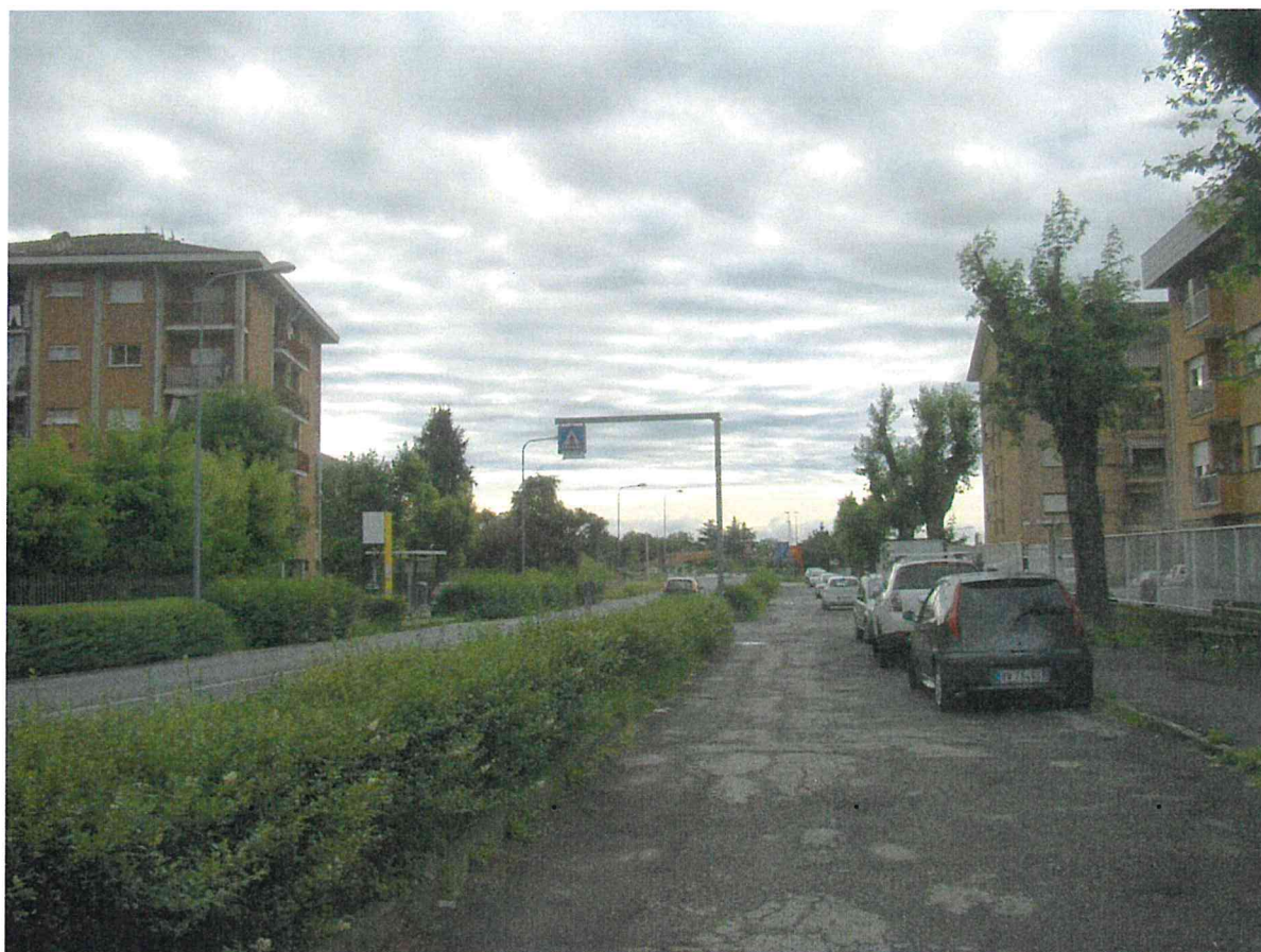
Fotografia 2 – Vista controviale – lato sud