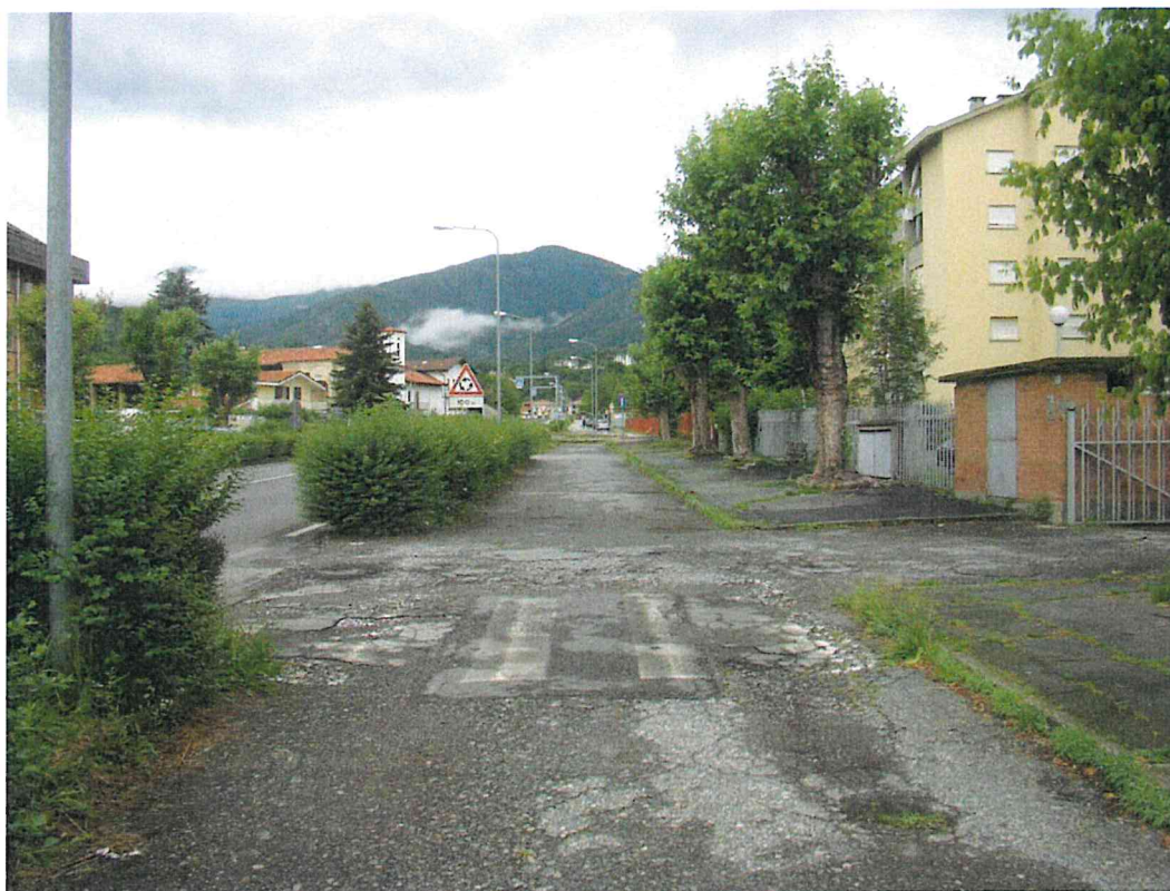
Fotografia 7 – Vista situazione segnaletica stradale – lato nord