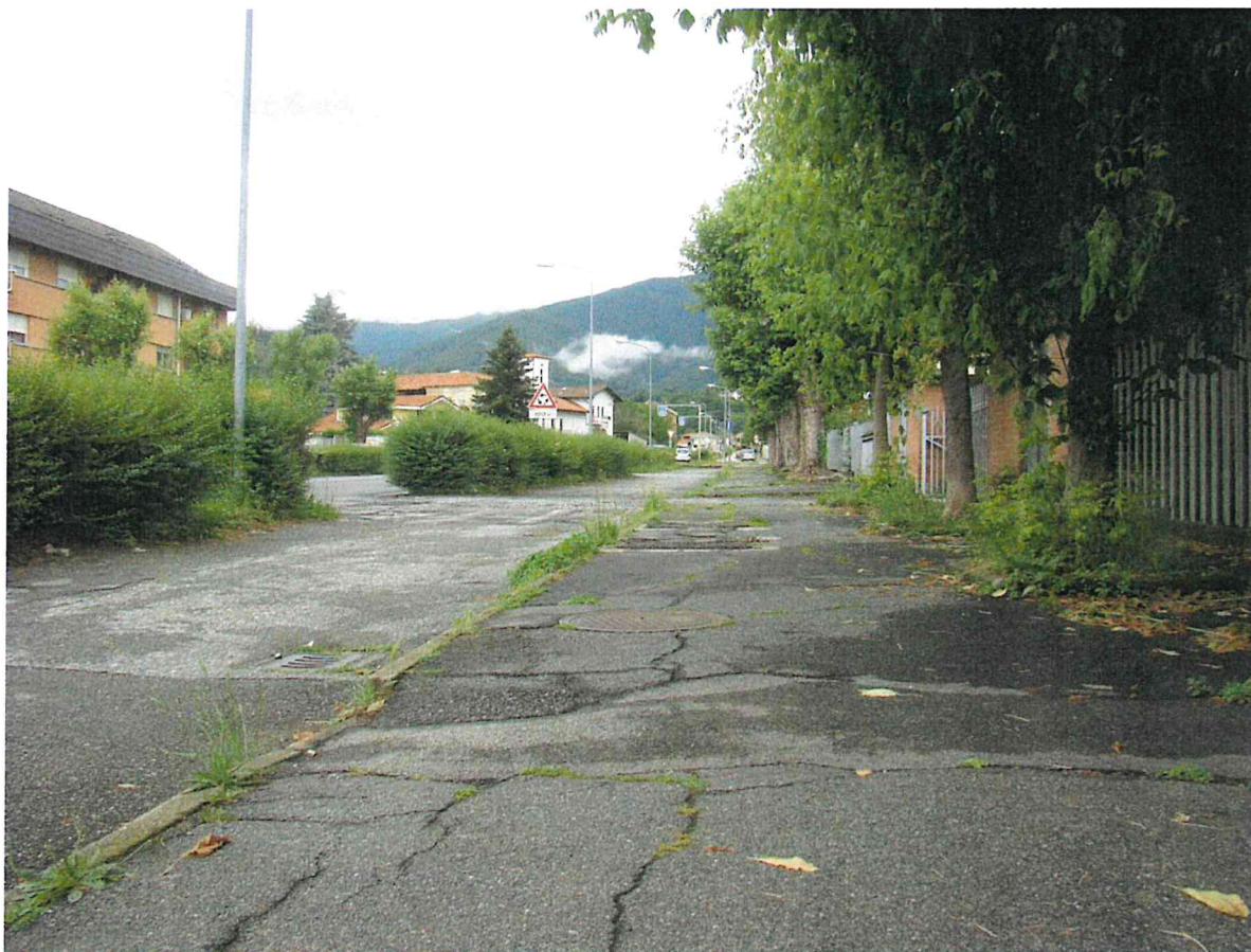
Fotografia 1 – Vista controviale - lato nord