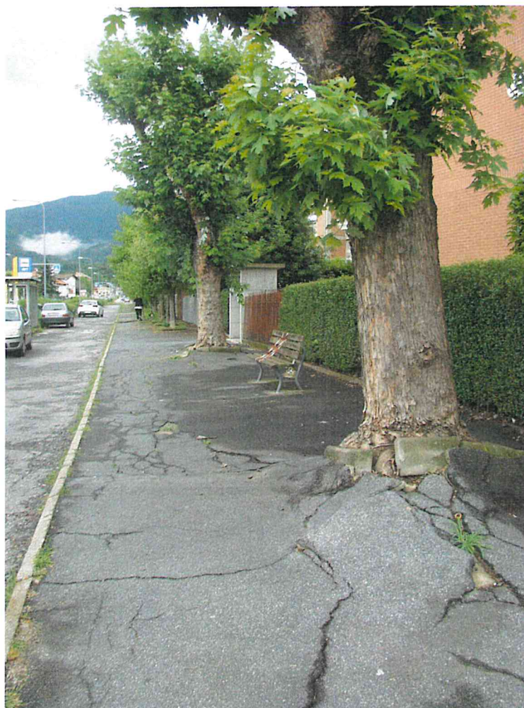
Fotografia 3 – Vista pavimentazione marciapiede – lato nord