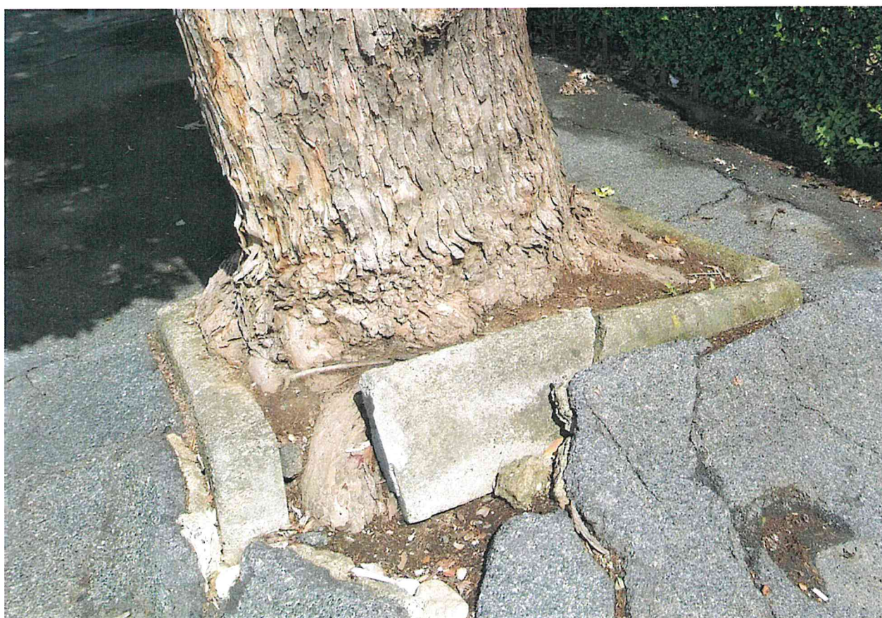
Fotografia 4 – Particolare deformazione pavimentazione e manufatti – lato nord