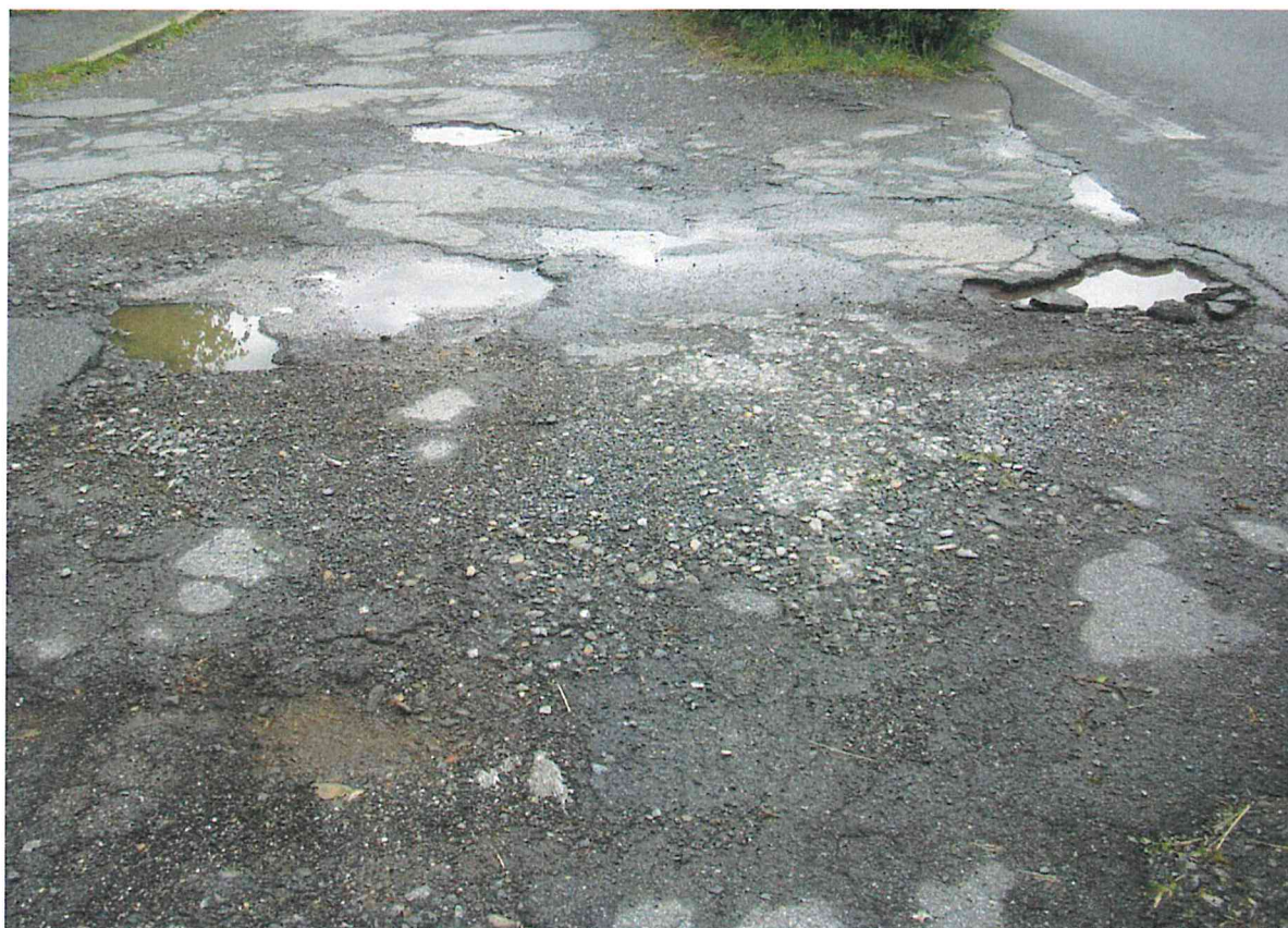
Fotografia 6 – Vista situazione pavimentazione stradale – lato nord