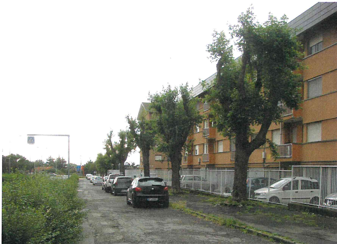
Fotografia 9 – Vista parcheggio lungo controviali – lato sud