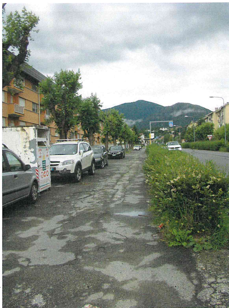
Fotografia 8 – Vista parcheggio lungo controviali – lato sud